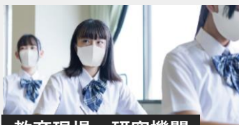
教育現場・研究機関

お客様訪問がある接客クルーやどうしても出社せざるを得ない職場でも、安心して働けることを目指します。