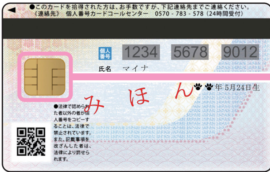
< うら面 >

うら面のICチップにあなた本人であることを証明する、「電子証明書」が入っているよ!